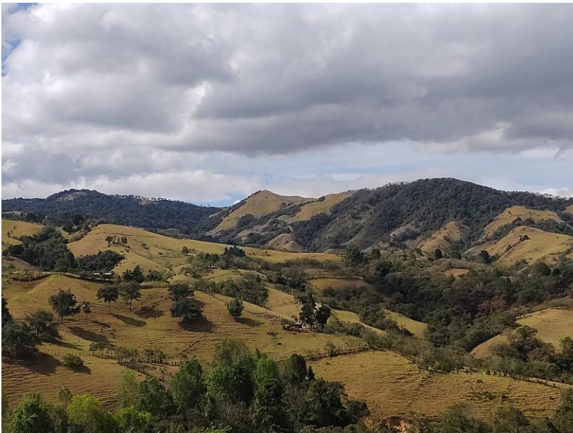
Zona Captación Cuenca río Molino cuenca Abastecedora – Municipio de Popayán

Acueducto y Alcantarillado de Popayán S.A. E.S.P